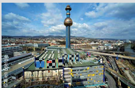
... und heute als eine der berühmtesten Anlagen der Welt.

2013: Wien Energie und Fernwärme Wien verschmelzen zu einem Unternehmen. Die Wiener Stadtwerke gründen zudem das Unternehmen Wiener Netze, welches das Gas- und Stromnetz, das Primärnetz der Fernwärme sowie die Telekommunikationsnetze unter einem Dach vereint