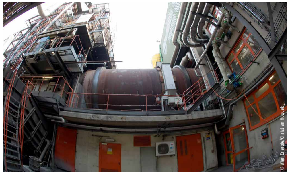
Feuerfeste Drehrohröfen vertragen extrem hohe Temperaturen und können daher auch Sonderabfälle unterschiedlichster Konsistenz verbrennen.

Umweltschutz als Unternehmensstrategie „Wärme aus Abfällen und nicht aus Primärenergieträgern wie Öl oder Gas zu gewinnen ist das Sinnvollste, was man im Energiebereich für die Umwelt tun kann“, ist Locher überzeugt. „Noch dazu