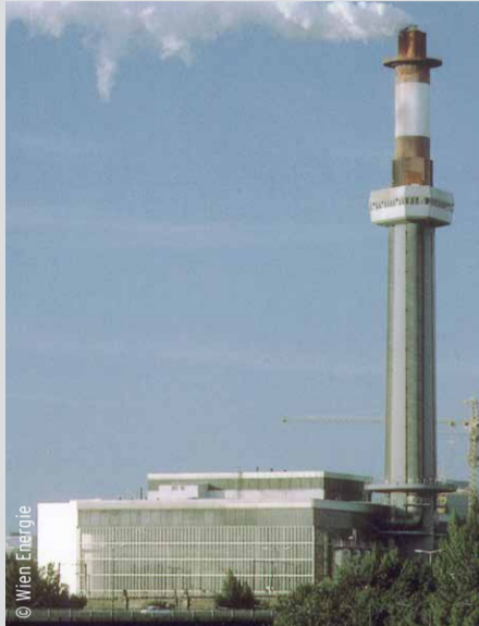
Die Anlage Spittelau vor dem Großbrand 1987 ...