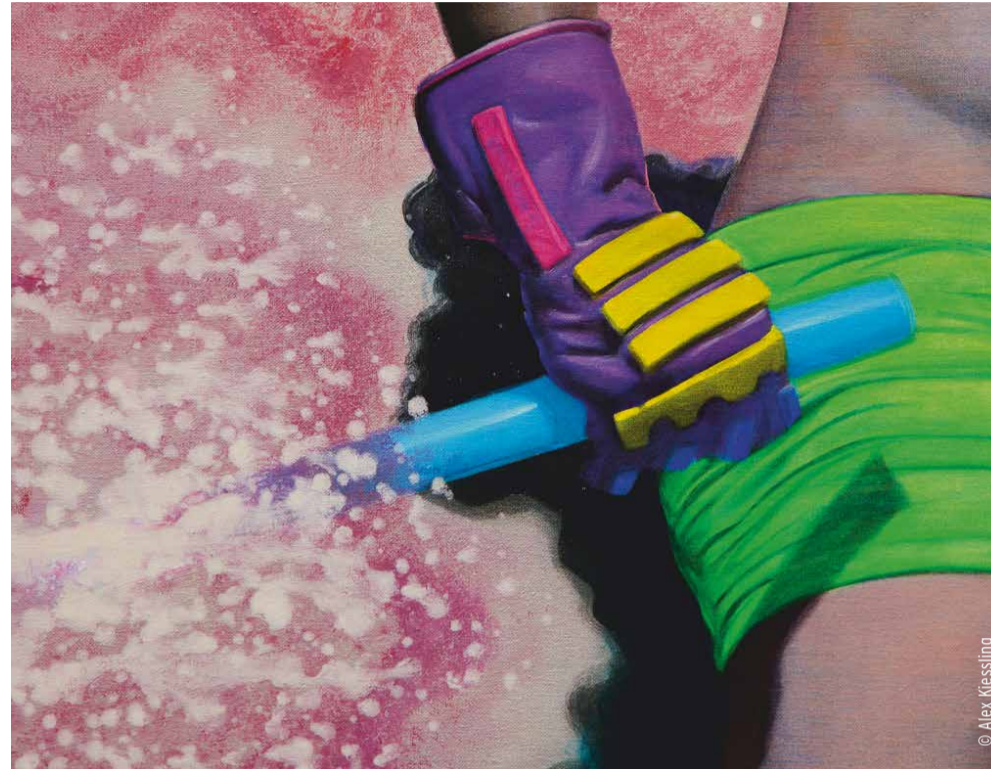
Der Wiener Künstler interessiert sich für die Wechselwirkung von realen und irrealen, traumhaften und virtuellen Welten.